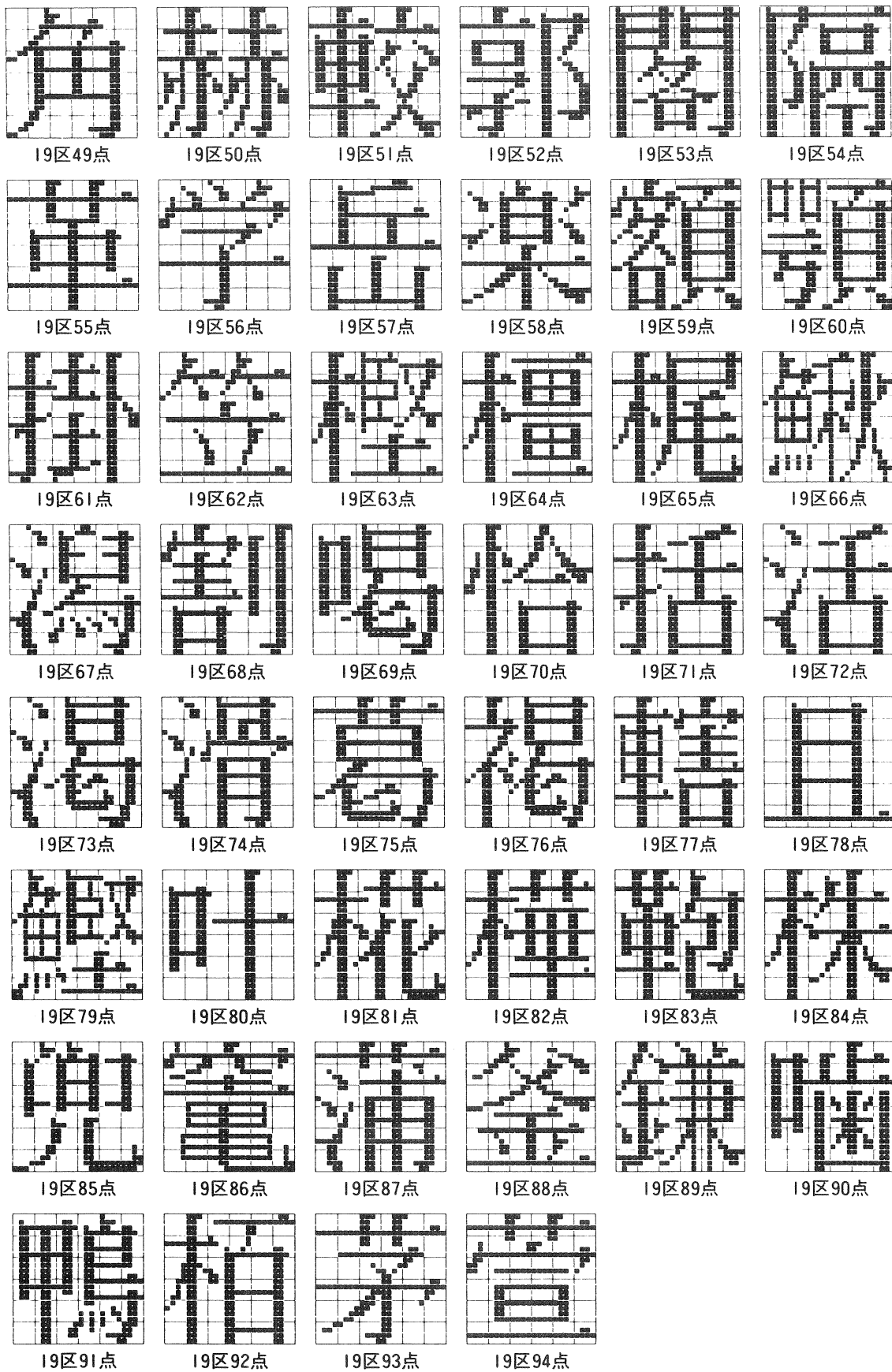
図7: JIS C 6234「ドットプリンタ用24ドット字形」制定(1983年9月1日)